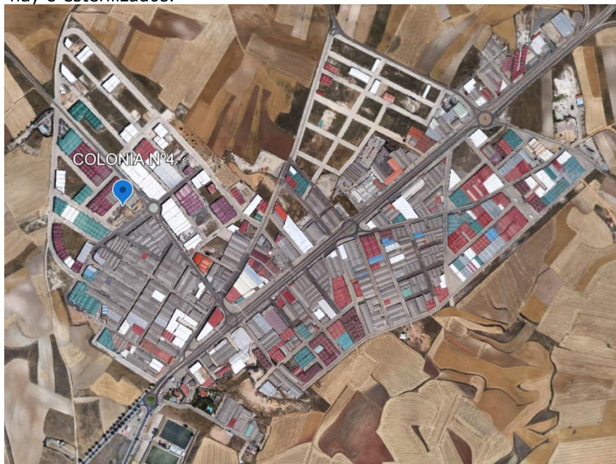
Figura 3. Ubicación de las colonias felinas del Polígono

La Colonia Nº4 se localiza en la Calle Oceanía, en el Polígono Los Villares, en una parcela municipal vallada. Está formada por 14 gatos, se desconoce el número total de machos y hembras y hay 8 esterilizados.