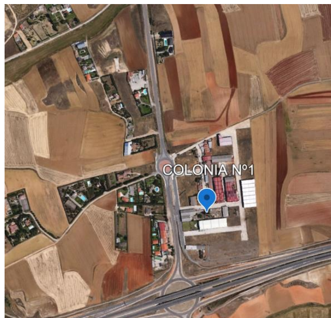
Figura 1. Ubicación de la colonia felina de Fuenteserrana

Los gatos de la Colonia N°1 se encuentran en una parcela habilitada con vallado y zonas de refugio. Está formada por 46 gatos, 27 hembras y 19 machos, de los cuales 41 están esterilizados.