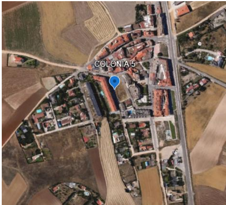
Figura 4. Ubicación de las colonias felinas de Aldeaseca de la Armuña

La colonia Nº 5 se ubica en la calle Mediodía, en Aldeaseca de la Armuña y está compuesta por 15 individuos. Se trata de 6 hembras y 9 machos de los cuales 10 están esterilizados.