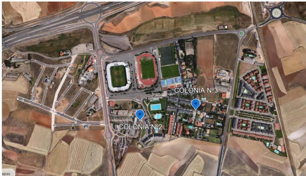
Figura 2. Ubicación de las colonias felinas de las urbanizaciones El Helmántico y El Viso y la Mina

La Colonia Nº3 se encuentra en la Calle Goya y está formada por 16 gatos, 7 hembras, 5 machos y 4 cachorros. De los gatos adultos, 7 están esterilizados actualmente.