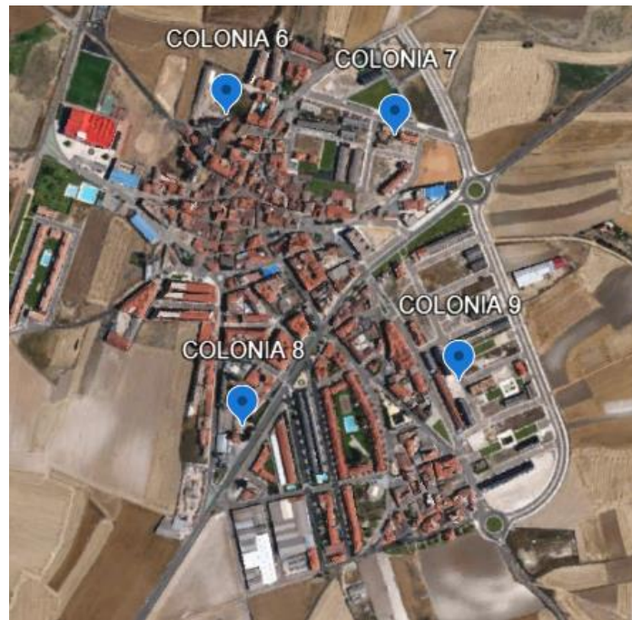
Figura 5. Ubicación de las colonias felinas en el Municipio de Villares de la Reina